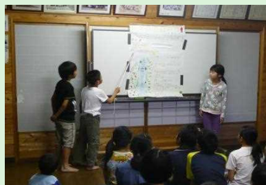
ホタルの学習発表会