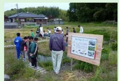
ビオトープでの生き物調査